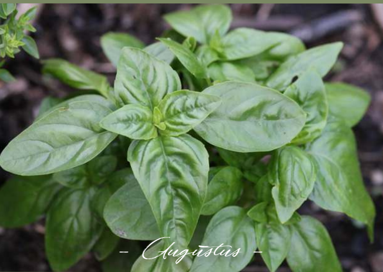
- Augustus -