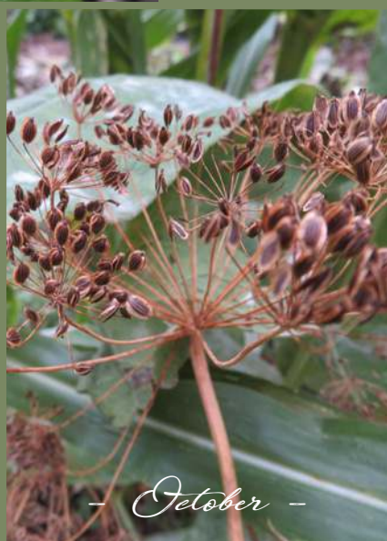
- Oktober -