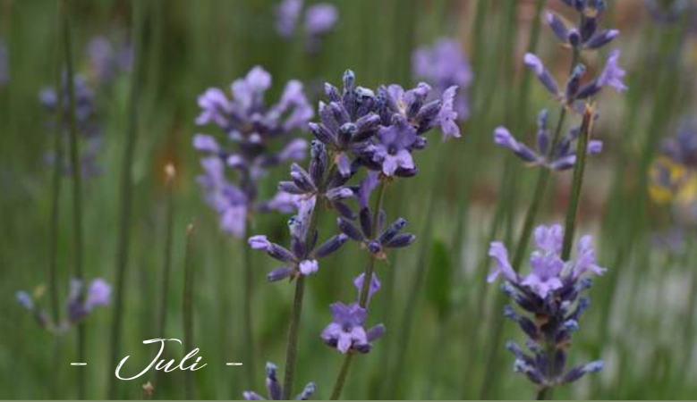
- Juli -