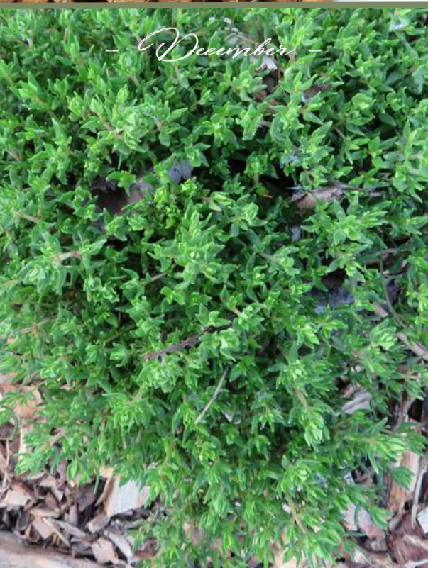
- December -