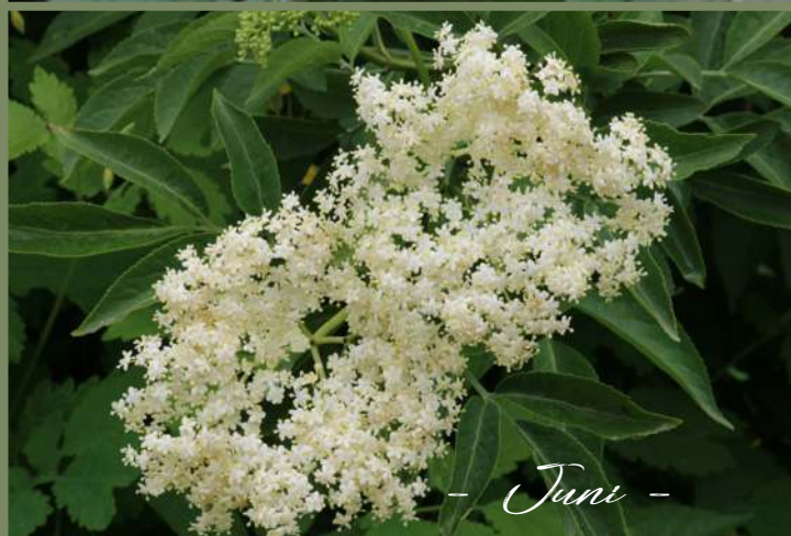
- Juni -