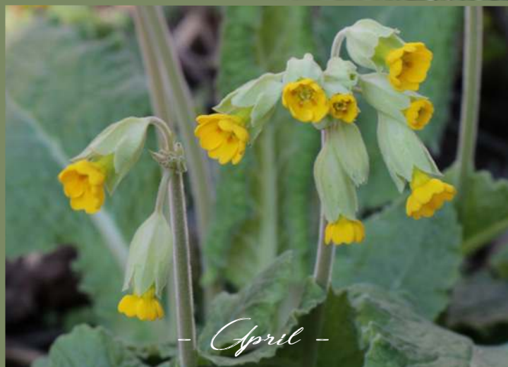
- April -