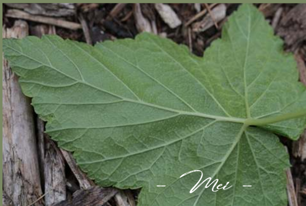
- Mei -