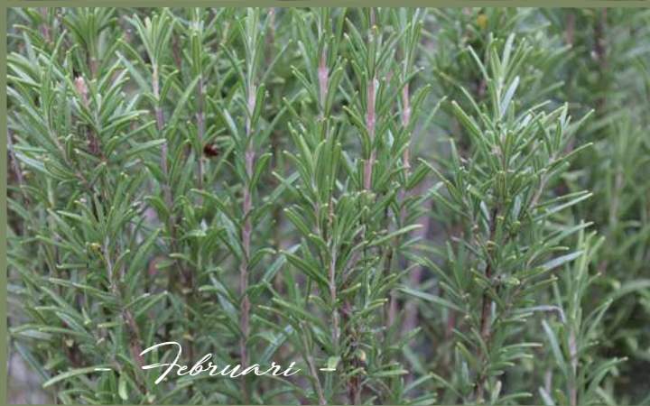
- Februari -