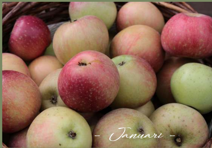
- Januari -

Het woord thee is voorbehouden voor een aftreksel van de theeplant. De drankjes die we maken van planten uit onze tuin zouden we 'aftreksels' of 'infuus' moeten noemen. Dat klinkt echter niet goed. We noemen ze dan ook gewoon kruidenthee. Veel planten uit de tuin lenen zich voor zo'n kruidenthee. Ik beperk me hier tot één plant per maand.