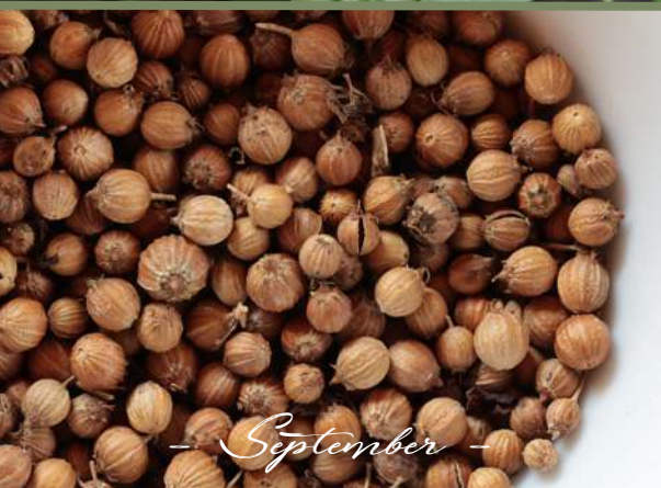
- September -