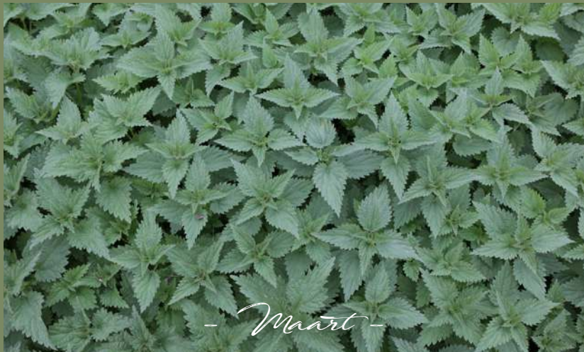
- Maart -