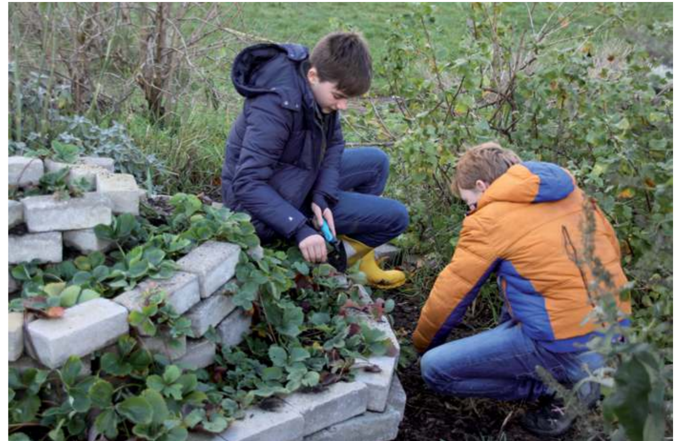
Leerlingen aan het werk.

lokaal liggen verschillende boeken over permacultuur die de leerlingen kunnen inkijken, zelfs een exemplaar van het Permacultuur Magazine is aanwezig!